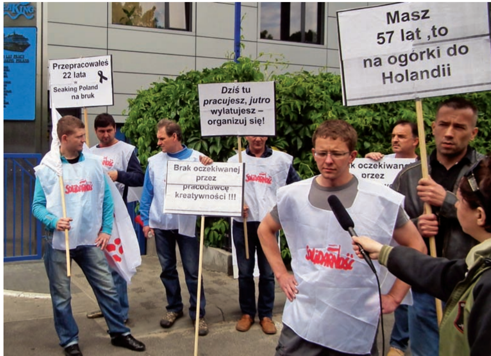
Związkowcy spółki Seaking w Czarnkowie protestowali przed zakładem w obronie swoich kolegów.

22 pracowników zamierza zwolnić Seaking Poland Ltd. Sp. z o.o. w Czarnkowie, firma produkująca wyposażenie do statków wycieczkowych. Większość zwalnianych to pracownicy z kilkunastoletnim stażem, średnia wieku 46 lat. Znajdują się wśród nich jedyni żywicieli rodziny. Wszyscy są zatrudnieni na czas nieokreślony. Zwolnienia mają nastąpić z przyczyn leżących po stronie pracownika, czyli bez odpraw.