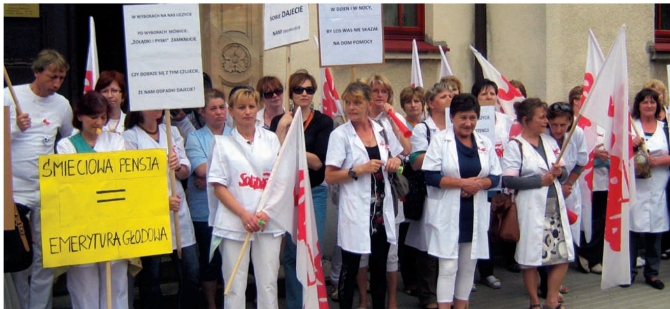
„Żądamy podwyżek, by godnie żyć”, „Władzo nie lekceważ wyborców” - pod takimi hasłami protestowali pracownicy DPS przed starostwem powiatowym w Śremie

Pracownicy domów pomocy społecznej w Śremie i w Parku domagają się podwyżek płac. W środę 30 maja ponad 80 z nich przeszło sprzed śremskiego budynku DPS pod siedzibę starostwa. Przed budynkiem, gdzie obradowała rada powiatu, odbyła się pikietą „Solidarności”.