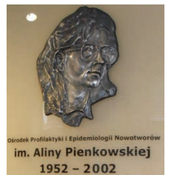
Ośrodek Profilaktyki i Epidemiologii Nowotworów im. Aliny Pienkowskiej 1952 - 2002

Była nie tylko jedną z najbardziej znanych i czynnych dzia-