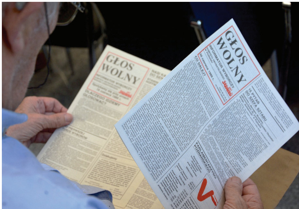
Rozmowy, wspomnienia i refleksje o przygotowaniach, przebiegu i efektach wyborów czerwcowych były kontynuowane podczas spotkania towarzyskiego, na które do hotelu „Ikar” zaprosiła wielkopolska „Solidarność”.

Wicewojewoda podkreśliła także, że zarówno Okrągły Stół wyborczy z 1989 roku to wynik działań i poświęcenia, często własnego życia, działaczy Niezależnego Samorządnego Związku Zawodowego „Solidarność”, który jako pierwszy, w tak mocny i zdecydowany sposób