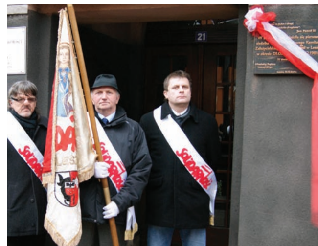
Pierwsza siedziba Zarządu Regionu NSZZ „Solidarność” w Lesznie mieściła się przy ul. B. Chrobrego 21.